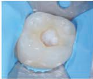
۷- یک لایه بسیار نازک از گلاس اینومر به روش ساندویچ استفاده کنید.