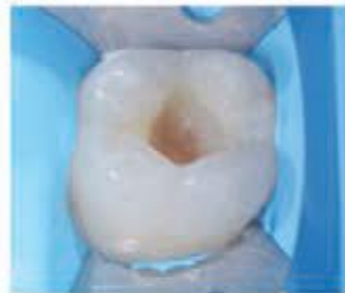
۳- برداشت و درمان پوسیدگی.