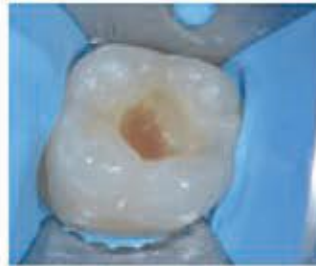
۶- باندینگ Iperbond را به مدت ۲۰ ثانیه قرار دهید. سپس بر روی آن به مدت ۵ ثانیه پوار بگیرید. این کار را برای بار دوم نیز تکرار کنید و برای مدت زمان ۲۰ ثانیه + ۲۰ ثانیه لایت کیور کنید.