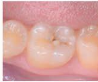
۲- فرم اولیه قبل از درمان پوسیدگی اکلوزالی بر روی دندان مولر اول فک پایین سمت چپ.