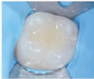
۹- قرار دادن ۲ لایه از reflectys A2 و لایت کیور کردن هر لایه به مدت ۲۰ ثانیه.