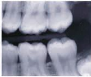
۱- X-ray پوسیدگی بر روی دندان ۶ پایین سمت چپ