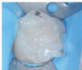
۱۱- قرار دادن گلیسرین و لایت کیور به مدت ۲۰ ثانیه.