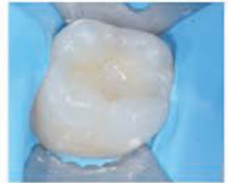
۸- قرار دادن یک لایه از reflectys -flow A3 و لایت کیور به مدت ۲۰ ثانیه.