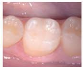
۱۲- نتیجه بعد از درمان و خشک کردن مجدد کامل.