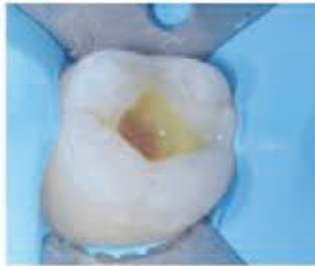
۵- به مدت ۱۵ ثانیه شست و شو دهید و حفره را خشک کنید تا زمانی که سفید و گچی شده باشد.