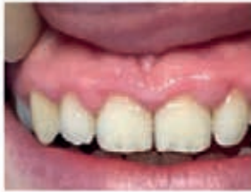
Gingival bead Day 2