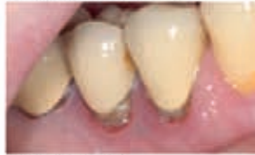
Recession Day 2