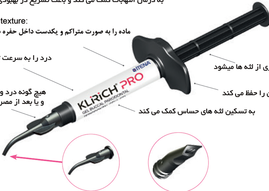
1 - Periodontal bent tip