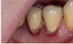
Recession Day 1