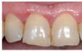
Papilla inflammation Day 2