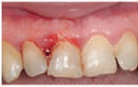
Papilla inflammation Day 1