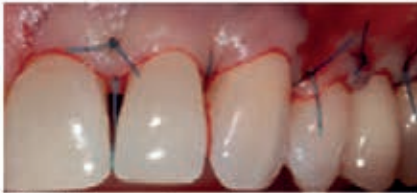
Periodontal surgery for root coverage