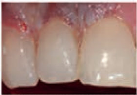
Inflammation before treatment