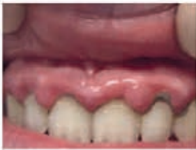
Gingival bead Day 1