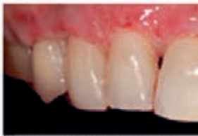
Inflammation after treatment